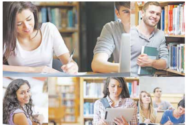
Den Lebensunterhalt im Studium finanzieren – dafür gibt es viele Wege.

BAföG und Stipendien bekommt nicht jeder. Nebenjobs fressen