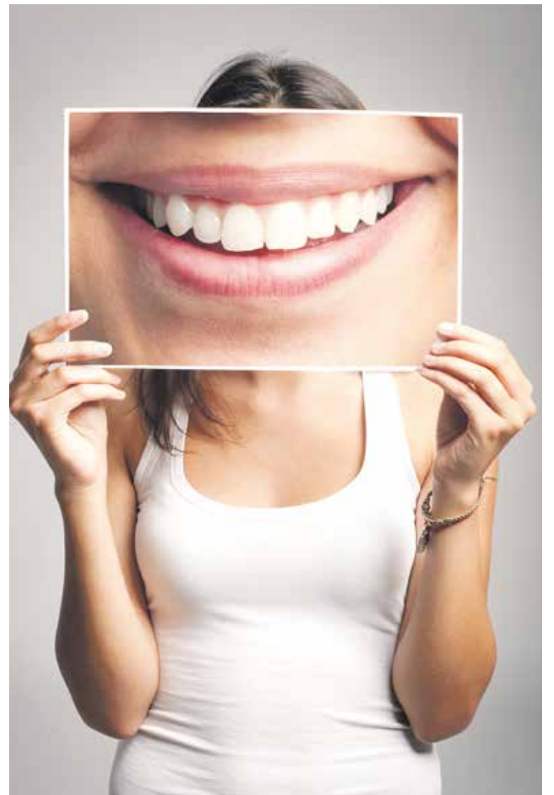
Ästhetischer Zahnersatz ist teuer – hier hilft eine Zusatzversicherung.

Was die gesetzliche Pflegekasse zahlt, deckt selten die tatsächlichen Kosten. Reichen Einkünfte und Vermögen des Pflegebedürftigen nicht aus, müssen Angehörige in direkter Linie – meist die Kinder – einspringen. Eine private Pflegetagegeldversicherung entlastet die Familie und erhält das Erbe. Sie zahlt, sobald eine Pflegestufe amtlich festgestellt wurde, ein Tagegeld. Seit 2013 gibt es staatlich geförderte Verträge – bei den Sparkassen heißen sie Förderpflege.