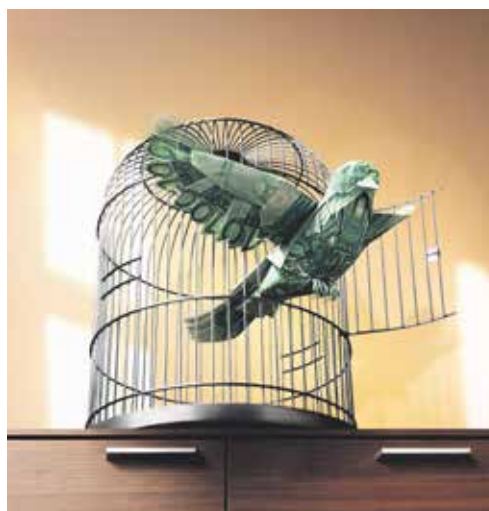
Befreien Sie Ihr Geld – mit Deka-BasisAnlage.

Mehr zu Deka-BasisAnlage erfahren Sie unter www.deka.de . Alleinverbindliche Grundlage für den Erwerb von Deka Investmentfonds sind die wesentlichen Anlegerinformationen, Verkaufsprospekte und Berichte, die Sie in deutscher Sprache bei Ihrer Sparkasse oder Landesbank oder von der DekaBank, Deutsche Girozentrale, 60625 Frankfurt und unter www.deka.de erhalten.