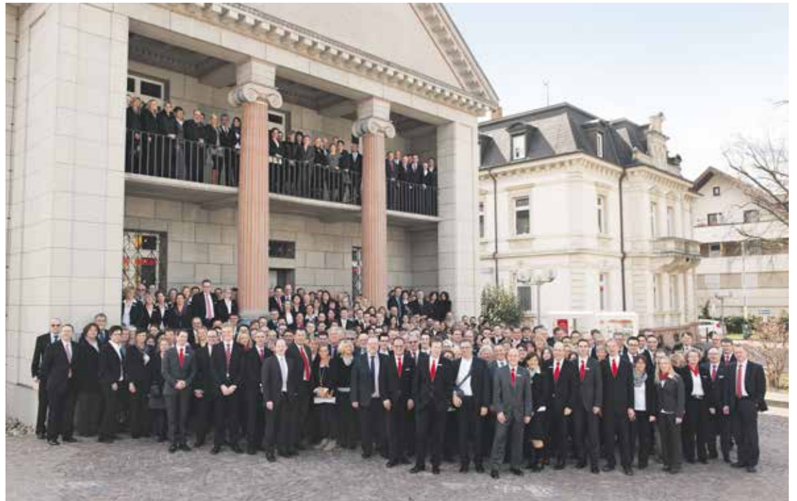
Die Mitarbeiterinnen und Mitarbeiter der Sparkasse Markgräflerland garantieren Ihnen hohe Qualität.

4. Bargeldgarantie: An unseren Geldautomaten garantieren wir Ihnen Bargeld rund um die Uhr. Sollte dennoch einer unserer Geldautomaten ausfallen und Ihnen entstehen Kosten bei anderen Banken, erstatten wir Ihnen diese, zusammen mit einer Aufwandsentschädigung von 5 Euro.