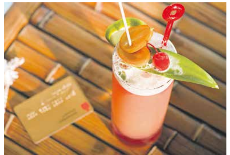
Urlaubsfreuden ohne Bezahlprobleme – zum Beispiel mit einer Kreditkarte.

Ihre girocard ist ein guter Urlaubsbegleiter in Europa: Trägt sie das Maestro-Symbol, können Sie in allen EU-Ländern damit Bargeld am Automaten abheben. Beim Bezahlen in Geschäften oder Restaurants wird sie in der Regel ebenfalls überall akzeptiert. Auch außerhalb der EU ist an vielen Geldautomaten das Geld abheben möglich.