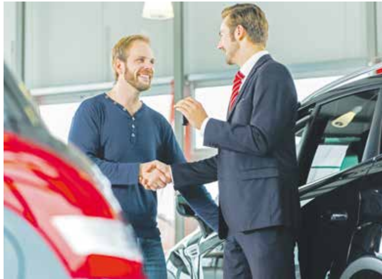
Ihr Wunschwagen steht beim Händler? Greifen Sie zu – mit dem Autokredit.

Und dies sind die Konditionen: Der effektive Jahreszins beträgt ab 2,99 Prozent jährlich, der Sollzinssatz ab 2,95 Prozent jährlich.* Der Nettokreditbetrag reicht von