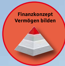
Bei guter Planung und cleverer Finanzierung haben Bauherren im Markgräflerland beste Aussichten.