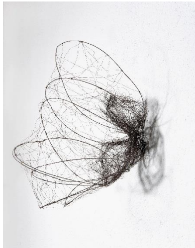
Suche nach Anknüpfungspunkten (2024) von Gabriela Morschett.