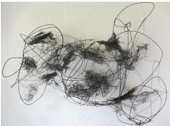
Orientierung im Liniengebirge (2022) von Gabriela Morschett.