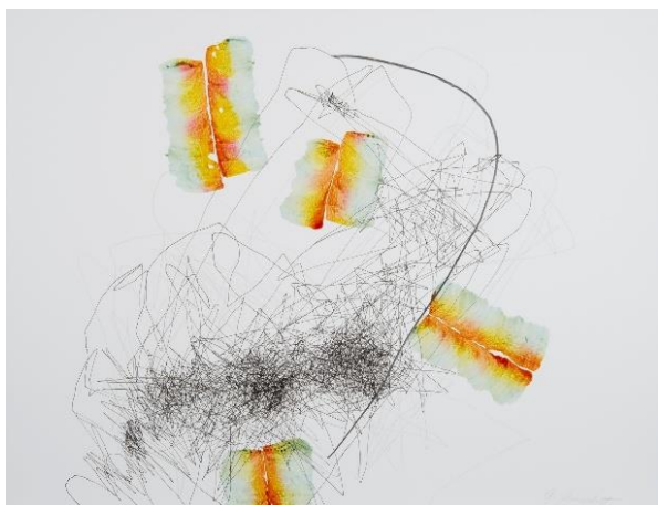
Gedankenwelt , Nr. 21 (2022) von Gabriela Morschett.

Bei Fragen zur Pressemitteilung wenden Sie sich bitte an: